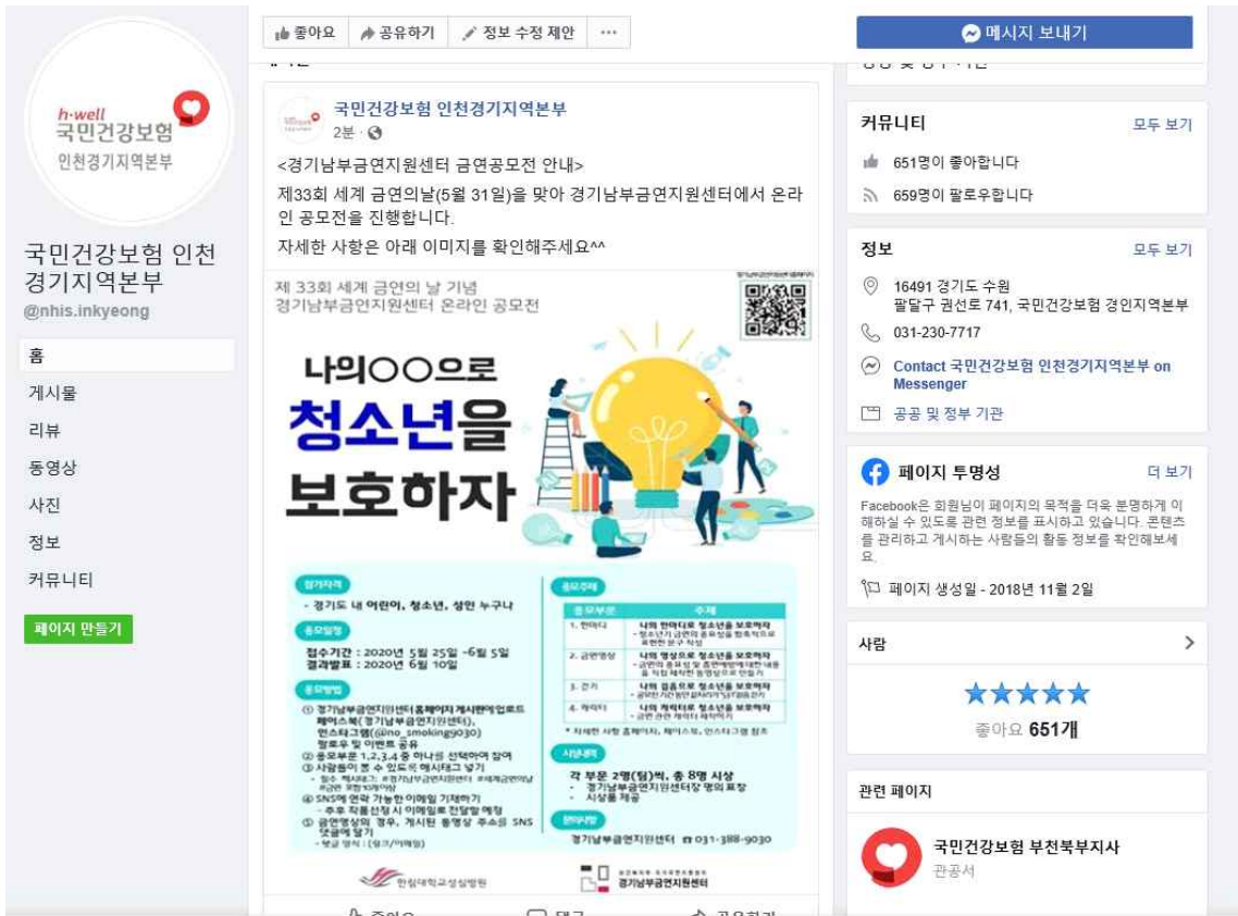
그림2. 국민건강보험 인천경기지역본부 페이스북