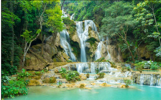
▶ 꺡씨푹포(Kuang Si Falls)