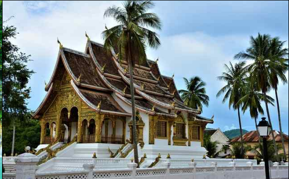
▶ 호 감 왕궁 박물관(Haw Kham Royal Palace)