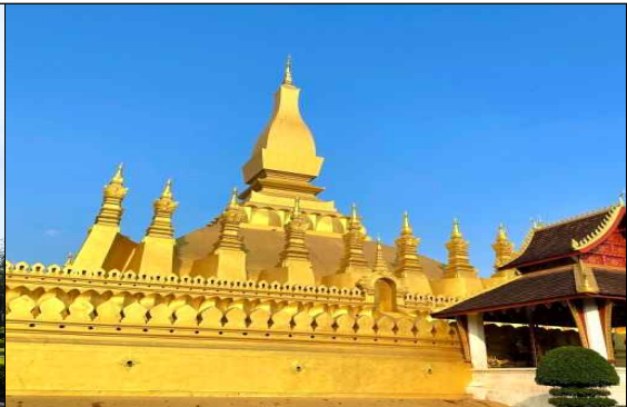
▶ 탃 루앙(That Luang)