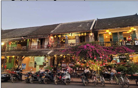
▶ 루앙프라방 여행자 거리